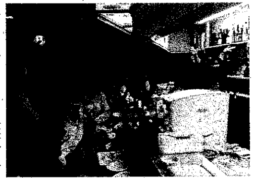
「はらこめし」を味わったみなさん